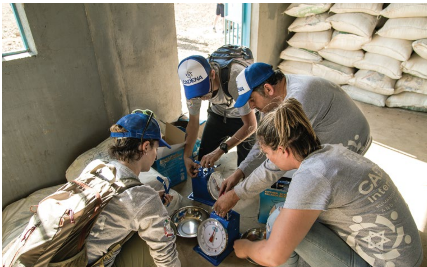
Misión de CADENA en Turkana, Kenia, 2017.